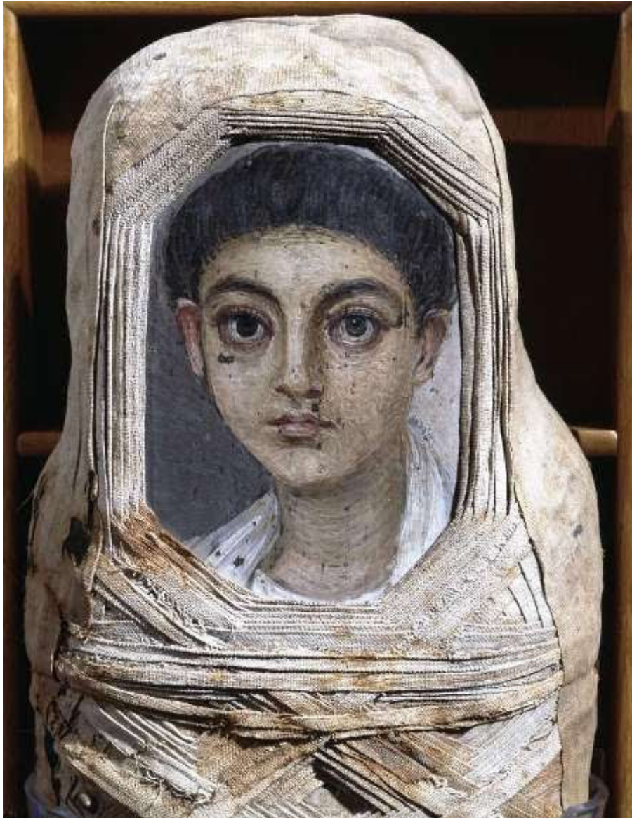
Εικόνα 2 Μούμια με Φαγιούμ