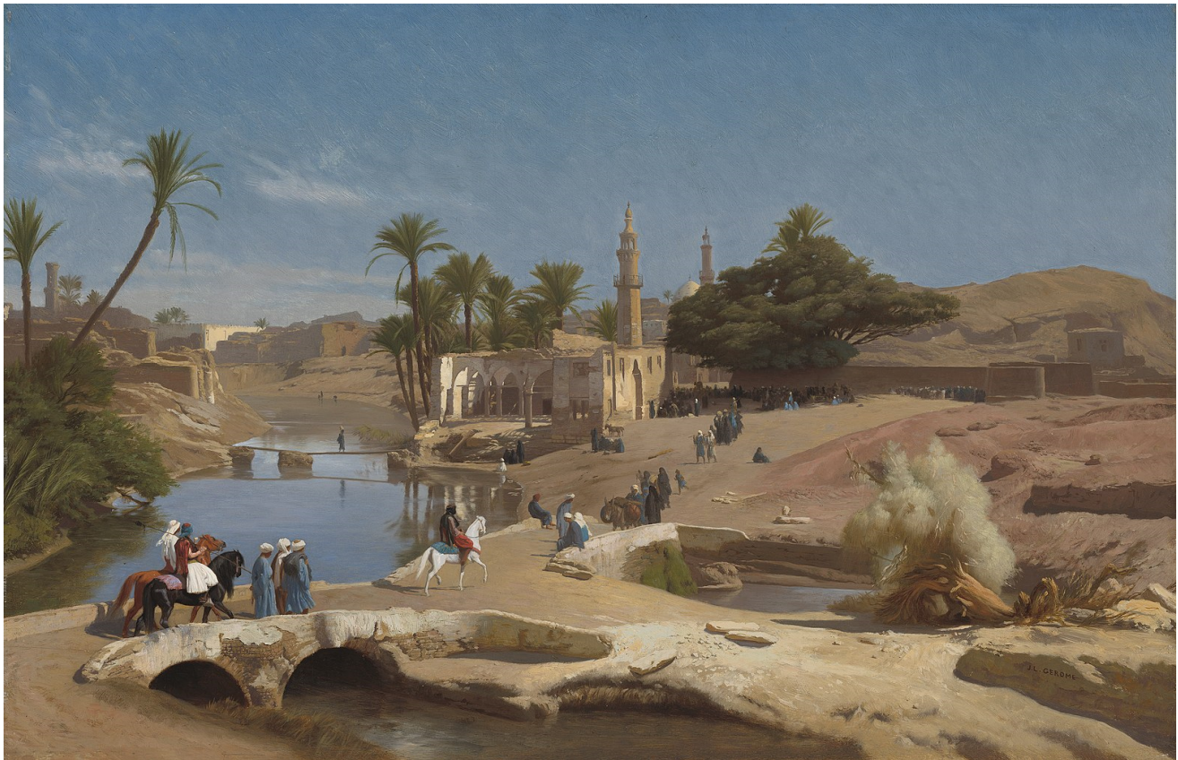
Εικόνα 1 Jean-Léon Gérôme, View of Medinet El-Fayoum , c. 1868–1870

Πορτραίτα Φαγιούμ: αποκαλούνται το σύνολο των προσωπογραφιών που φιλοτεχνήθηκαν από τον 1 ο ως τον 3 ο αι. μ.Χ. από συνεχιστές της ύστερης ελληνιστικής παράδοσης της Αλεξανδρινής Σχολής και διασώθηκαν ως τη σημερινή εποχή. Βρεθήκανε σ' ανασκαφές στην όαση Φαγιούμ έξω από το Κάιρο, ενσωματωμένα σε αιγυπτιακές μούμιες, με ρωμαϊκά χτενίσματα, ρούχα και κοσμήματα και με ελληνική τεχνοτροπία. Για αρκετά χρόνια τα μουσεία τα παρουσίαζαν σαν ξεχωριστή κατηγορία. Κι όμως, είναι μοναδικά, εναπομείναντα δείγματα από την τέχνη της Ελληνιστικής περιόδου της Αιγύπτου. Τ' ανακάλυψε κι ανέφερε 1ος ο Ιταλός περιηγητής Πιέτρο ντελα Βάλλε (Pietro Della Valle) το 1615. Αυτά τα νεκρικά πορτραίτα, προορισμένα για ταφική χρήση, πήρανε τ' όνομά τους από την όαση Φαγιούμ, επειδή εκεί ανακαλύφθηκαν τυχαία τα 1α δείγματά τους.