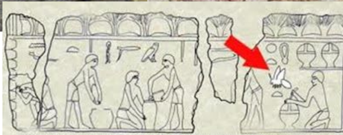
9.10. Breathing or blowing smoke into a hive. Niuserre's Temple, Abu-Gurob, Dynasty V.