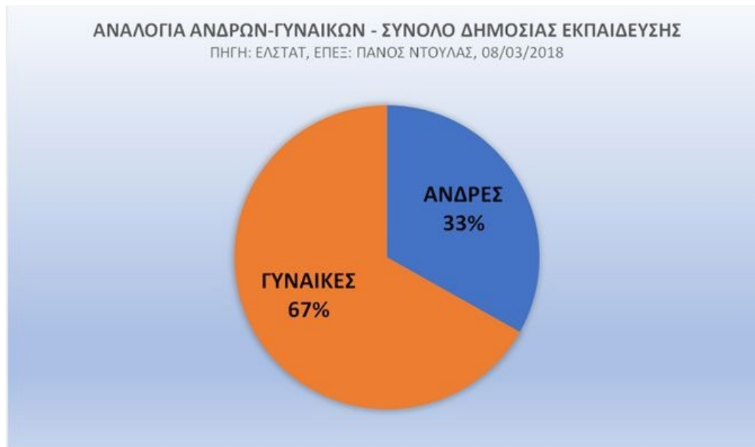
Διάγραμμα 1: Συνολική αναλογία ανδρών-γυναικών εκπαίδευσης